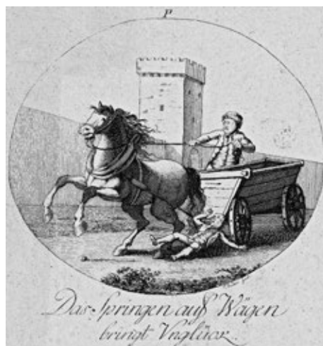
Obr. č. 12: Skákání z jedoucího vozu