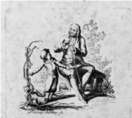
Obr. č. 7: Muž s holí na lavičce hovoří s dítětem