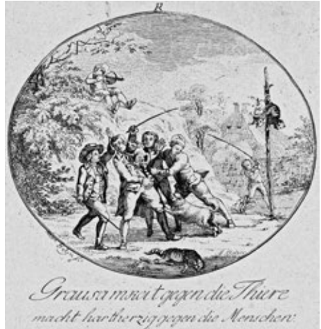
Obr. č. 14: Hruzně týrání zvířat