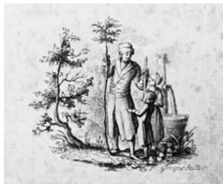
Obr. č. 4: Muž sázející stromek se dvěma dětmi