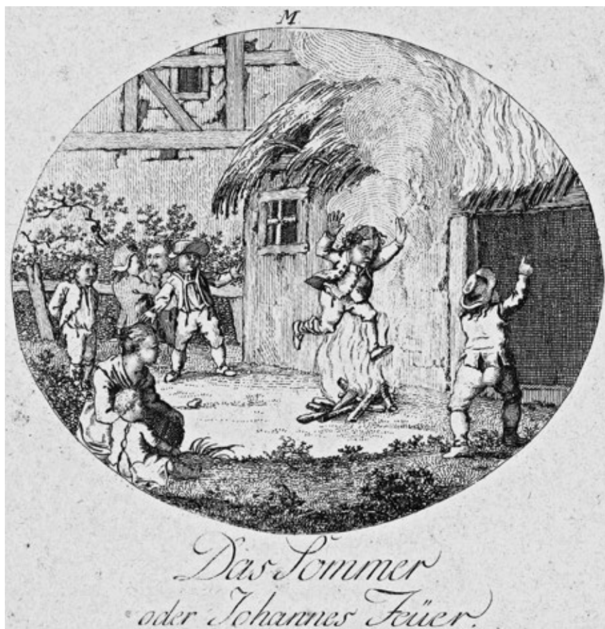
Obr. č. 10: Nebezpečné letní „svatojanské“ ohně