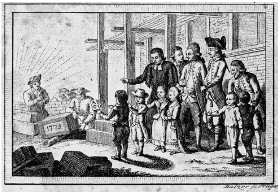
Obr. č. 2: Titulní viněta