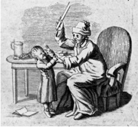
Obr. č. 5: Muž trestající dítě nákoskou