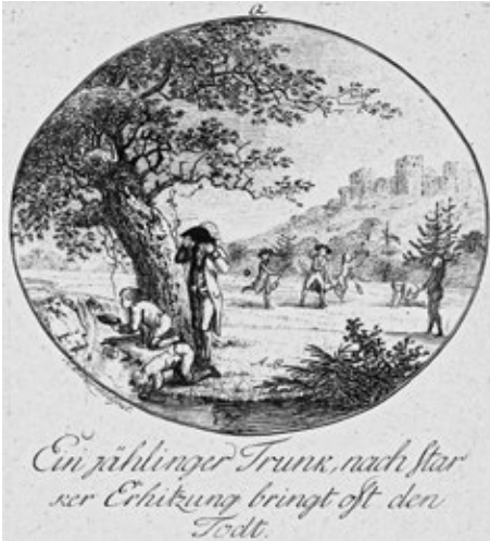
Obr. č. 13: Nebezpečné pití po přehřátí