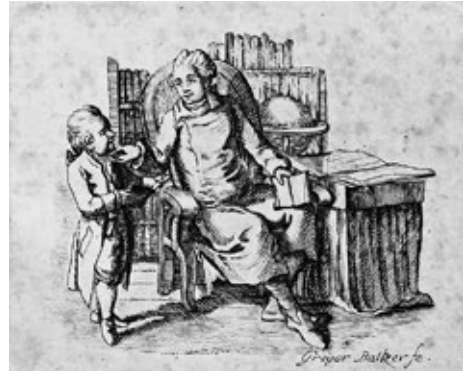
Obr. č. 6: Muž s knihou v ruce u knihovny hovoří s dítětem