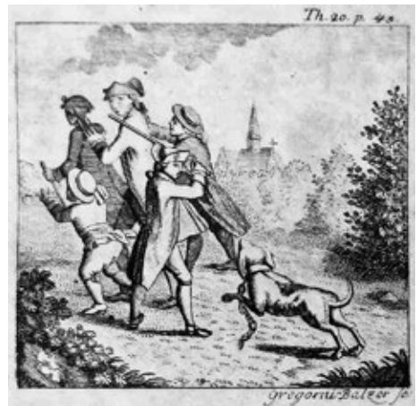
Obr. č. 9: Čtyři muži a dítě