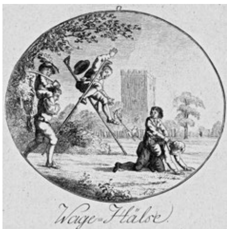
Obr. č. 11: Pád z chůd