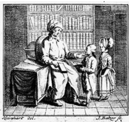
Obr. č. 3: Titulní viněta