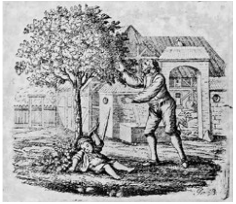
Obr. č. 8: Dítě spadnuvší z ovocného stromu