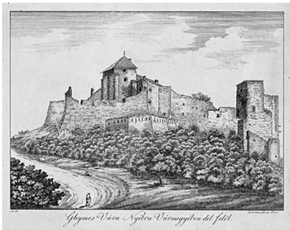
Obr. č. 1: Hrad Gymeš v dobovom zobrazení.