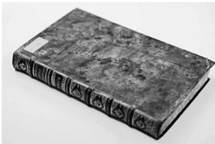
Obr. č. 2: Ukážka úpravy povrchu usne mramorovaním