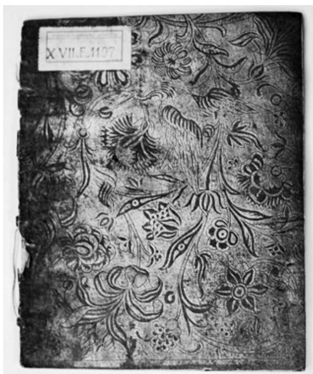
Obr. č. 4: Ukážka mäkkej papierovej väzby s brokátovým papierom