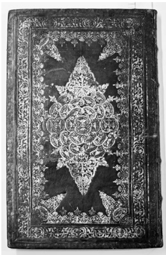
Obr. č. 1: Ukážka knižnej väzby z univerzitnej knihárskej dielne s červenou usňou a zlátenou slepotlačou