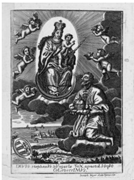
Obr. č. 6: Frontispice v diele Prodigium Principum od J. Jägera (Trnava, 1759)