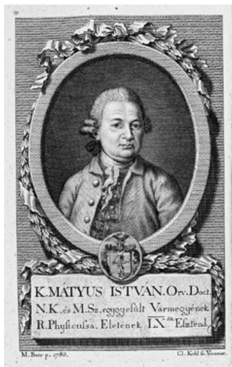
Obr. č. 3: Portrét Istvána Matyusa od K. Kohla v práci Ó es Új Diaetetica (Bratislava, 1787)