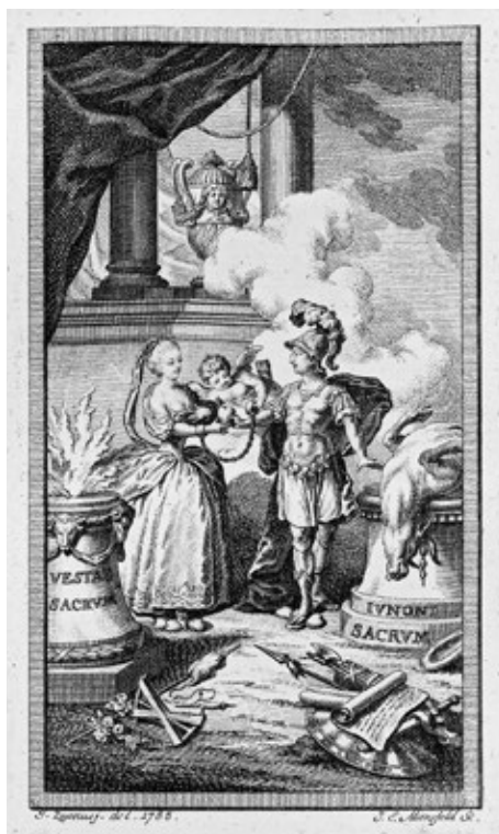
Obr. č. 1: Ilustrácia od J. A. Mansfelda do diela Probleme Sceptique Est-Il Bon De Se Marier? (Trnava, 1783)