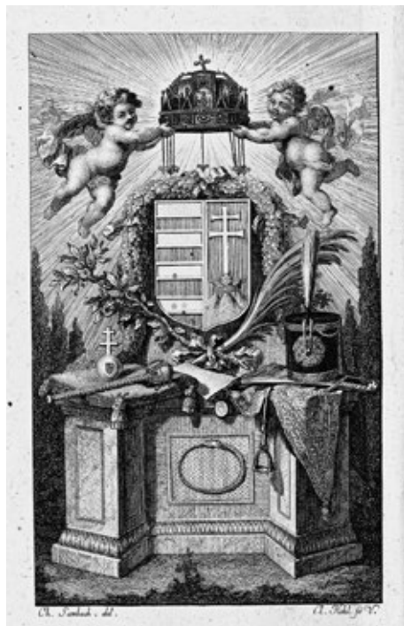
Obr. č. 4: Ilustrácia do diela Theorie der Säulenordnung od K. Kohla (Bratislava, 1790)