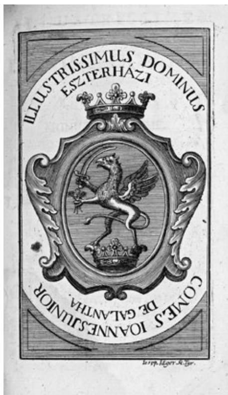
Obr. č. 7: Rytina erbu od J. Jägera